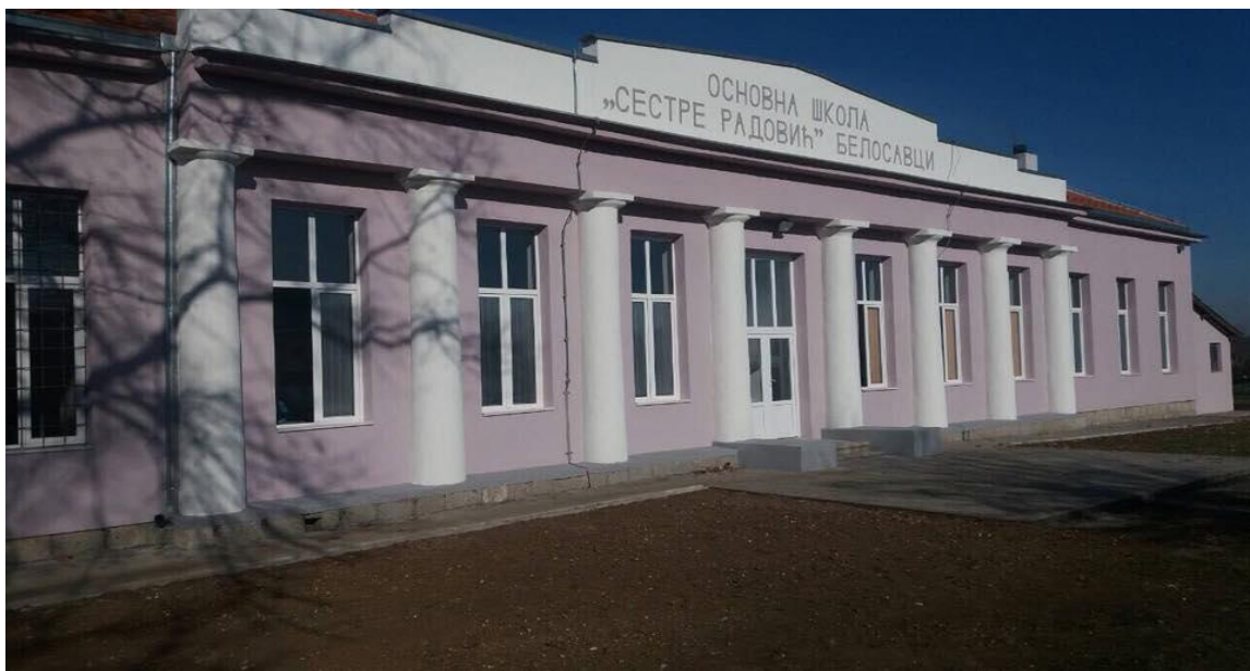
Матична школа у Белосавцима

Основна школа „ Сестре Радовић “ налази се у центру Белосавца и обухвата основним образовањем и васпитањем од 1. до 8. разреда децу са подручија шест месних заједница и то: Белосавца, Загорице, Јеленца, Маскара, Рајковца и Копљара.