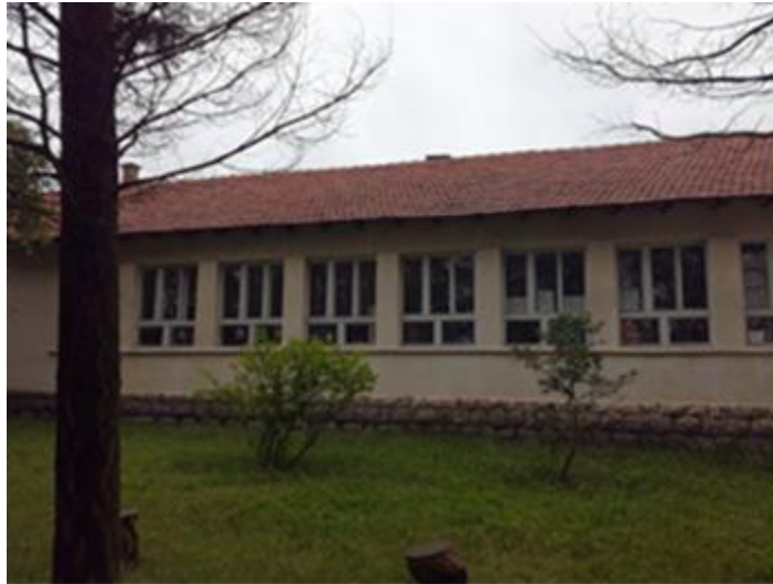
Издвојено одељење Маскар

У месној заједници Маскар школа има две учионице, ходник, наставничку канцеларију, стан за наставника и салу за потребе ученика и омладине. Поред школе постоји уређен парк са школским двориштем и игралиштем. Настава се изводи у два комбинована одељења за ученике од 1. до 4. разреда из места Маскар и Рајковац. Зграда је изграђена после другог светског рата и у прилично је лошем стању (кров, столарија, грејање...). У наредном периоду планирана је детаљнија реконструкција ове зграде. Од матичне школе удаљена је око 8 километара.