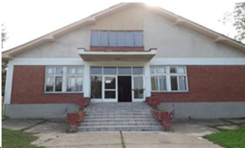
Издвојено одељење у Загорици

Зграда се налази у центру села, а од матичне школе удаљена је око 10 километара. У зимском периоду и кишном периоду ово место је често „одсечено“ од околних места, јер река Кубршница преко које води пут, излије из свог корита и направи велику поплаву. Поред тога, крај је брдовит па на путу често има и леда што такође отежава комуникацију.