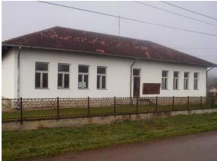
Издвојено одељење у Јеленцу

У месној заједници Јеленац школска зграда је направљена 1945. године, има две учионице, наставничку канцеларију, ходник и помоћну просторију. Учионице су простране и светле са високим плафонима, али без интернета и скромно опремљене. Место је веома лепо, око 5 километара удаљено од Белосаваца, пут раван, а школа се налази у центру села. У дворишту је асфалтиран терен за кошарку и рукомет, а у близини је и фудбалски терен локалног фудбалског клуба. Настава се одвија у комбинованом одељењу У месној заједници Јеленац школска зграда је направљена 1945. године, има две учионице, наставничку канцеларију, ходник и помоћну просторију. Учионице су простране и светле са високим плафонима, али без интернета и скромно опремљене. Место је веома лепо, око 5 километара удаљено од Белосаваца, пут раван, а школа се налази у центру села. У дворишту је асфалтиран терен за кошарку и рукомет, а у близини је и фудбалски терен локалног фудбалског клуба. Настава се одвија у комбинованом одељењу